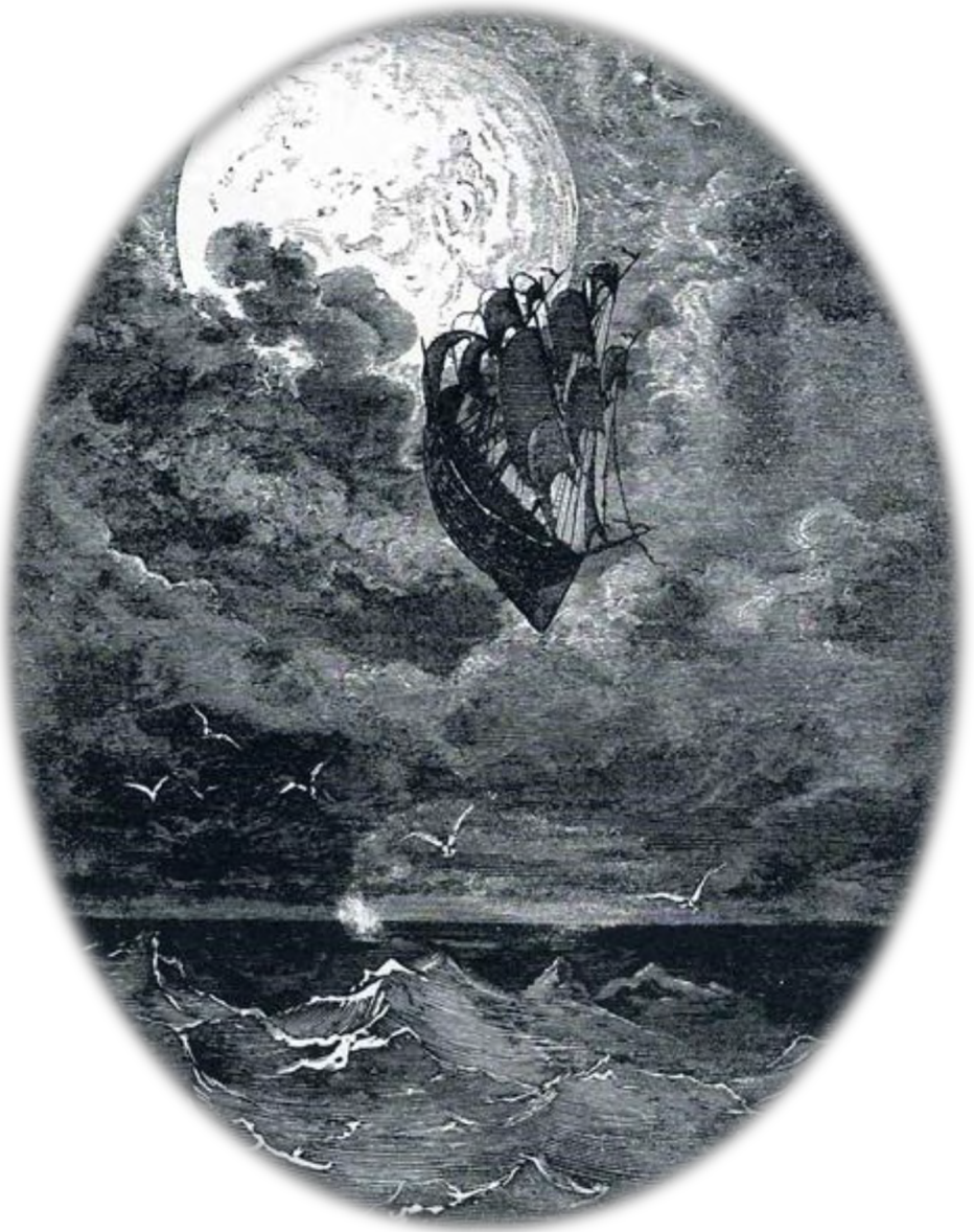
Illustration ci-contre : Le voyage vers la Lune, Les aventures du Baron Munchausen, Doré G., 1868

Illustration de l'affiche : Atlas du Cosmos d'Alex. v. Humboldt en 42 planches avec explica- tions, Humboldt A. & Braume T., Stuttgart : Krais & Hoffmann, 1851